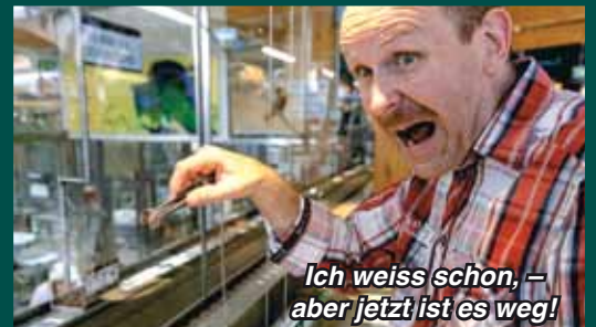
Ich weiss schon, - aber jetzt ist es weg!