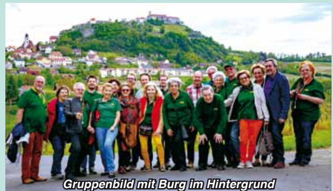
Gruppenbild mit Burg im Hintergrund