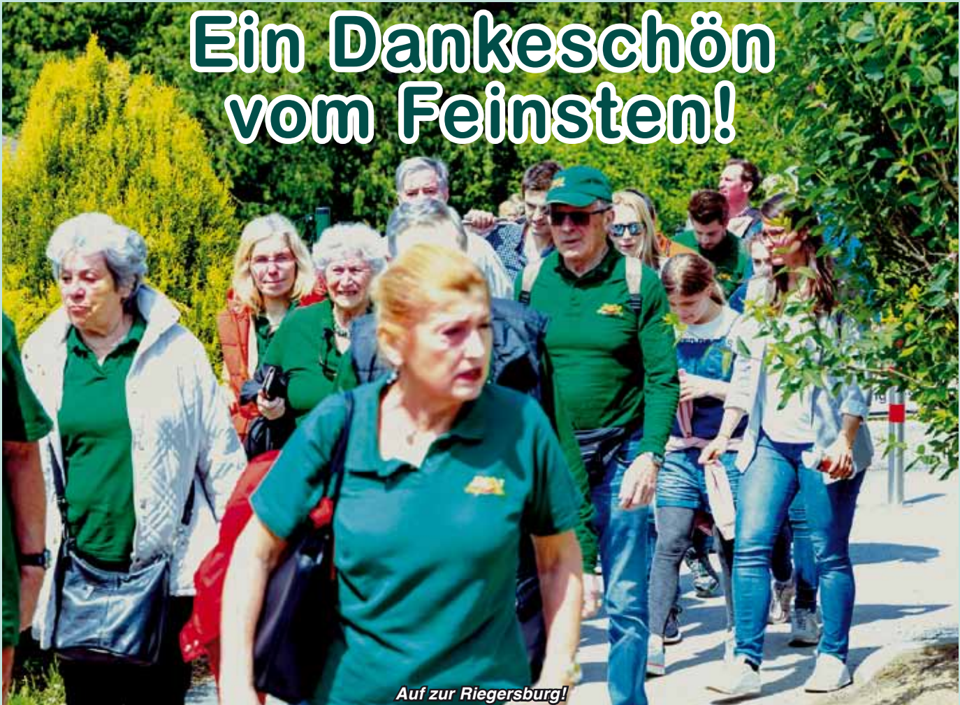
Auf zur Riegersburg!