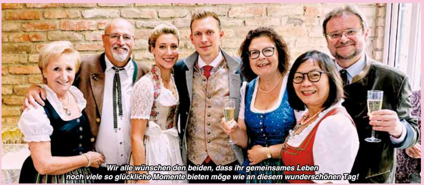
Wir alle wünschen den beiden, dass ihr gemeinsames Leben noch viele so glückliche Momente bieten möge wie an diesem wunderschönen Tag!