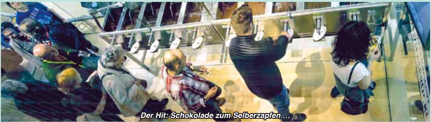
Der Hit: Schokolade zum Selberzapfen ...