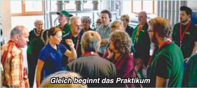
Gleich beginnt das Praktikum