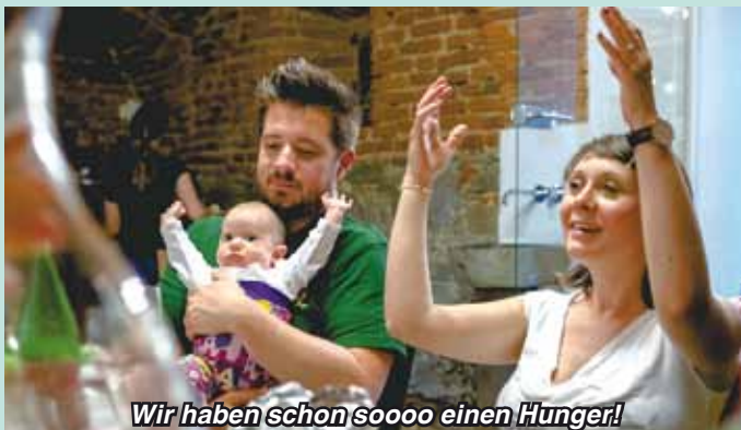
Wir haben schon soooo einen Hunger!