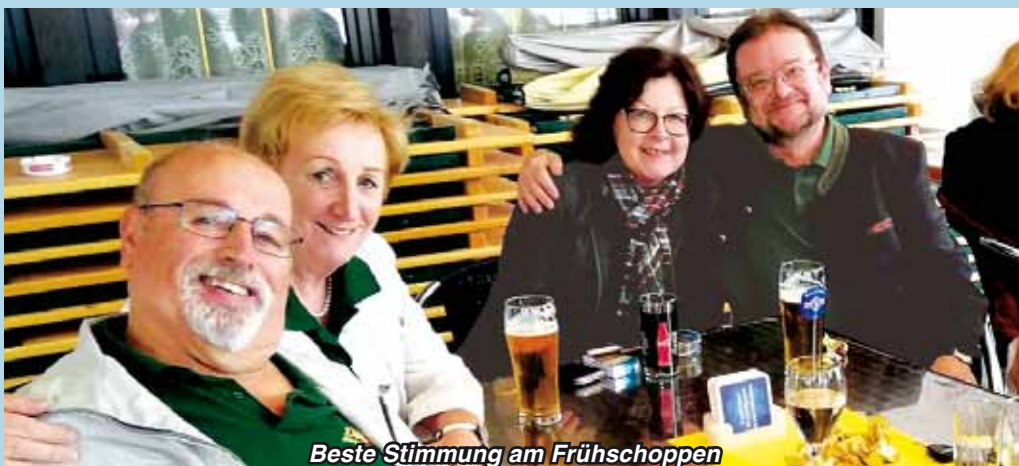
Beste Stimmung am Frühschoppen

e in buntes und abwechslungsreiches Programm erwartete die Besucher des 57. Bundesverbandstags, den die Fachsingsgilde Köflach von 17. bis 19. Mai ausrichtete. Neben der offiziellen Verbandstagung standen Besuche der Glasbläserei Bärnbach und des Lipizzanergestüts Piber ebenso auf dem Programm wie ein typisch steirischer Hüttenabend, ein eleganter Galaabend sowie ein zünftiger Frühschoppen. Unseren steirischen Freunden ein herzliches Danke für die gelungene Tagung!