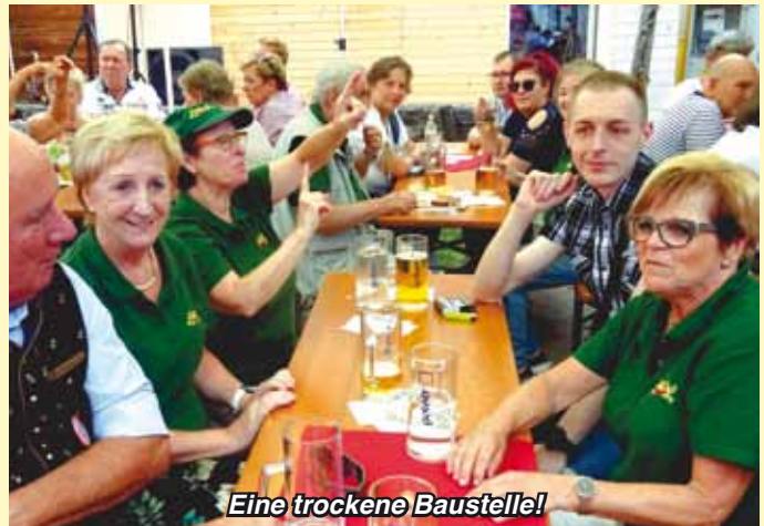
Eine trockene Baustelle!