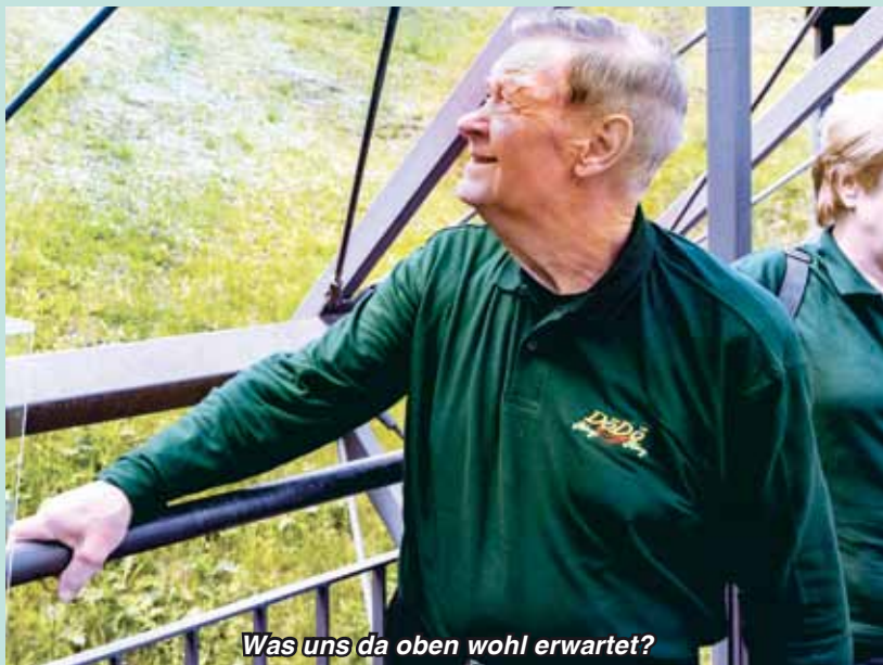
Was uns da oben wohl erwartet?