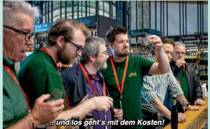
... und los geht's mit dem Kosten!