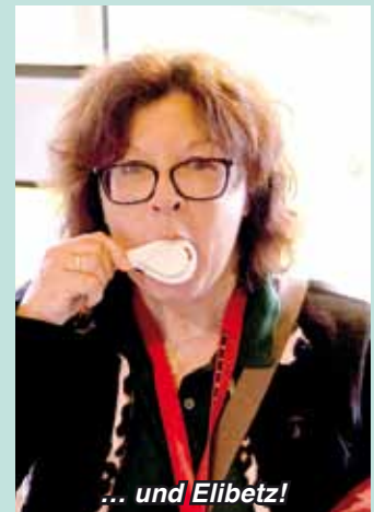
... und Elibetz!