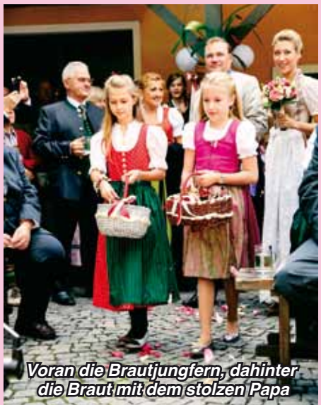
Voran die Brautjungfern, dahinter die Braut mit dem stolzen Papa