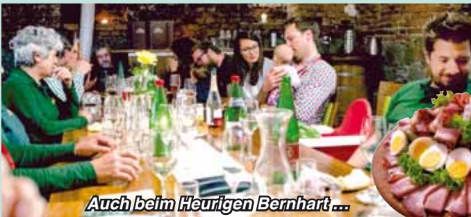
Auch beim Heurigen Bernhart ...