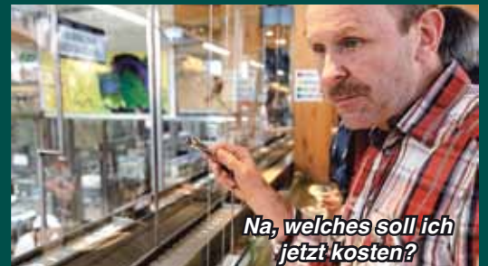
Na, welches soll ich jetzt kosten?