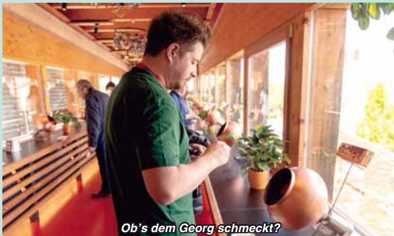
Ob's dem Georg schmeckt?