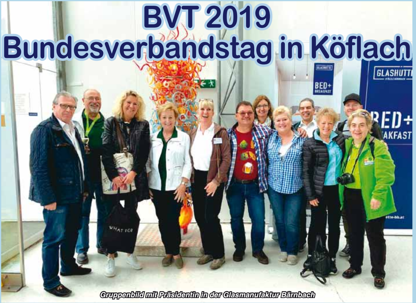
Gruppenbild mit Präsidentin in der Glasmanufaktur Bärnbach