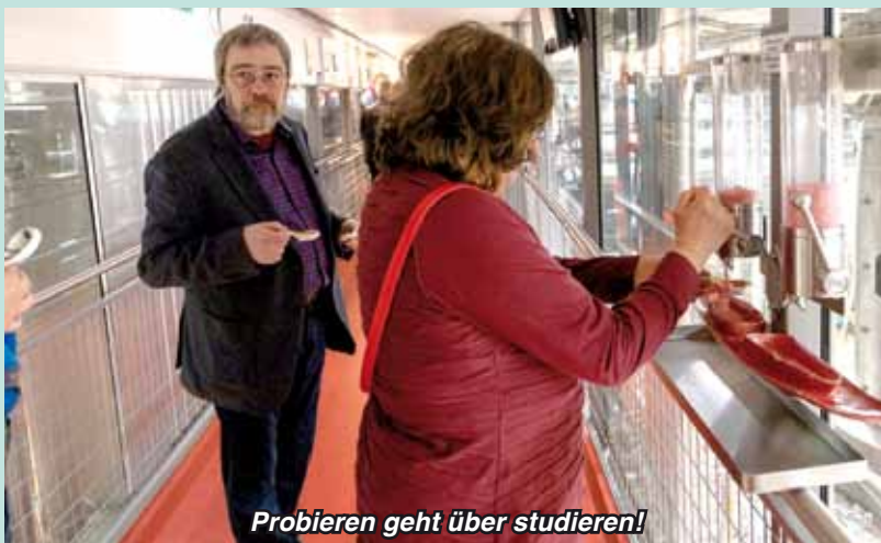
Probieren geht über studieren!