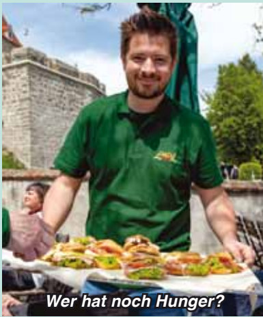
Wer hat noch Hunger?