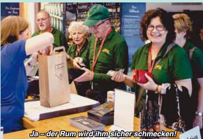
Ja – der Rum wird ihm sicher schmecken!