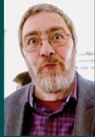
Oder doch nicht so richtig?