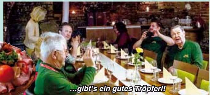
...gib'ts ein gutes Tröpferl!