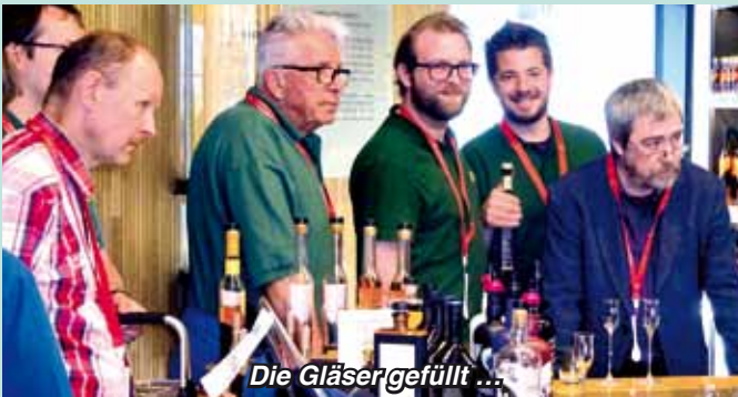
Die Gläser gefüllt ...