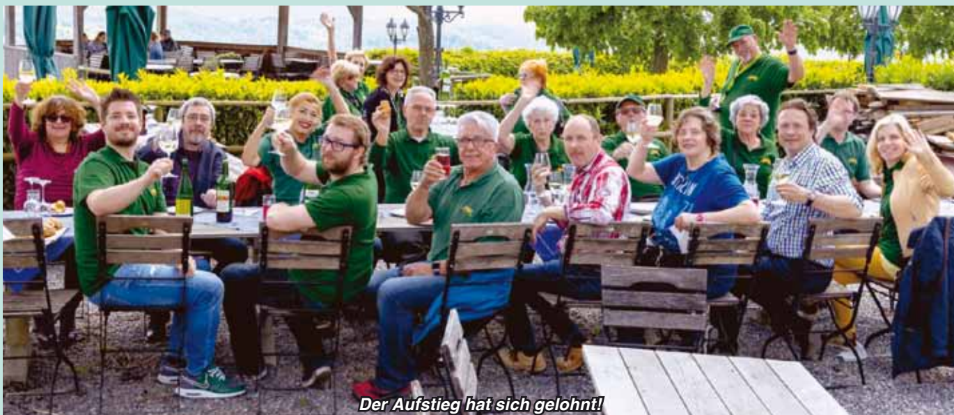
Der Aufstieg hat sich gelohnt!