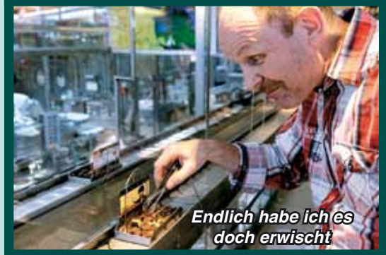
Endlich habe ich es doch erwischt