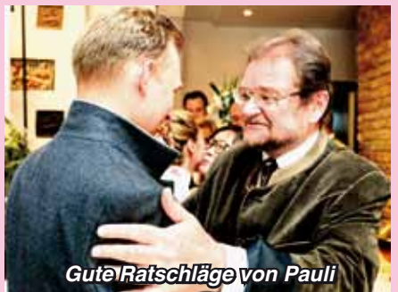
Gute Ratschläge von Pauli