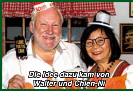
Die Idee dazu kam von Walter und Chien-Ni