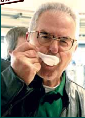
Wie schmeckt die Rohkakaomasse?