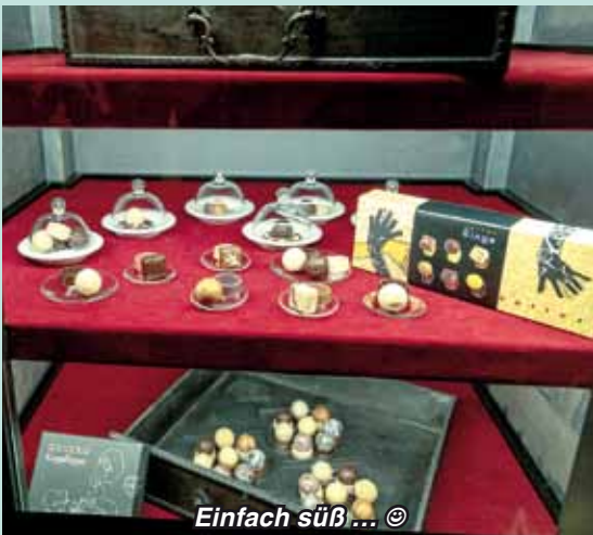
Einfach süß...