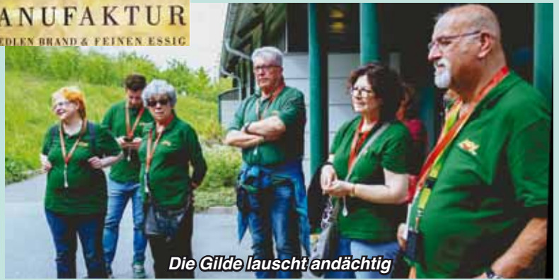
Die Gilde lauscht andächtig