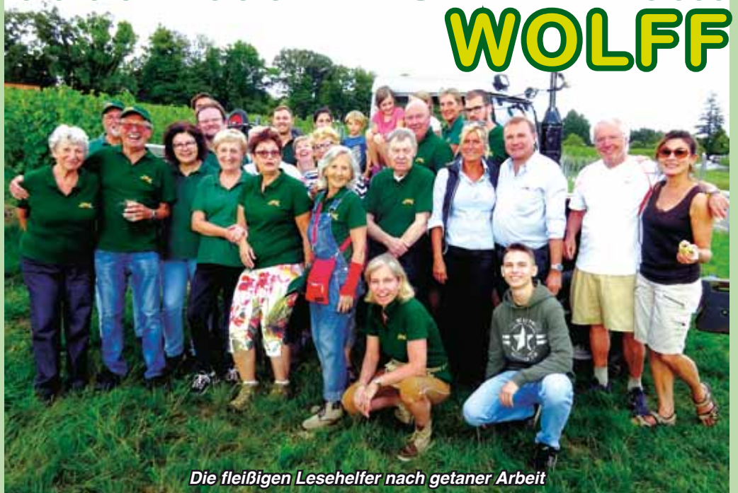
Die fleißigen Lesehelfer nach getaner Arbeit

Das die Gilde dem Hause Wolff ganz fleißig bei der Weinlese hilft, ist in den letzten Jahren bereits zur lieben Tradition geworden. Damit dies auch diesmal so wurde, hat sich die Gilde auch heuer wieder sehr ins Zeug gelegt, und wieder war es schließlich ein prall gefüllter Lesewagen voller Trauben, die den Weg in die Weinpresse fanden.