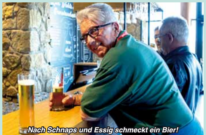
Nach Schnaps und Essig schmeckt ein Bier!