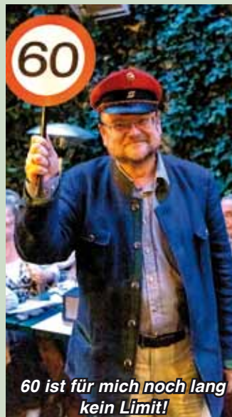
60 ist für mich noch lang kein Limit!