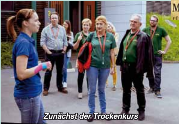
Zunächst der Trockenkurs