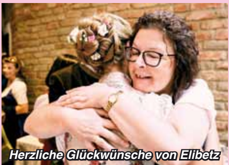
Herzliche Glückwünsche von Elibetz