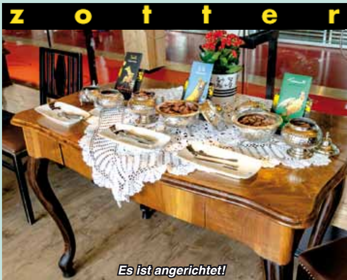
Es ist angerichtet!