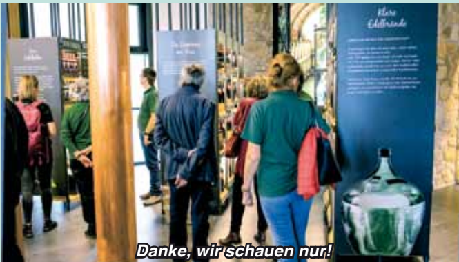
Danke, wir schauen nur!