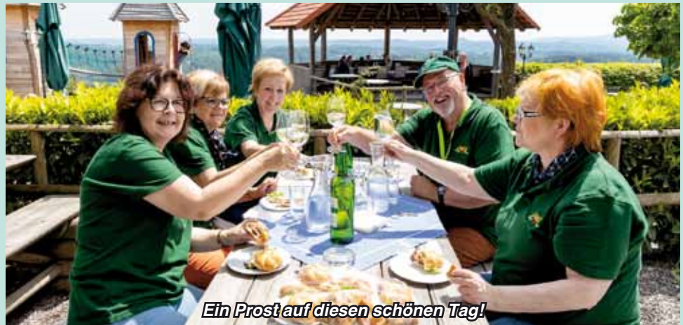
Ein Prost auf diesen schönen Tag!