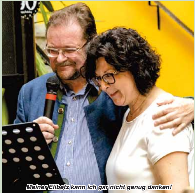
Meiner Elibetz kann ich gar nicht genug danken!