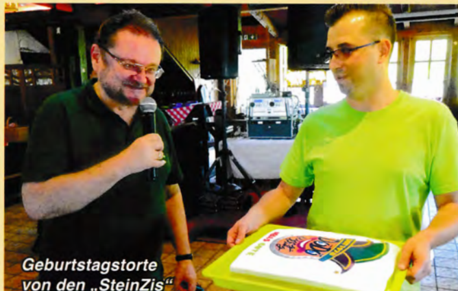
Geburtstagstorte von den „SteinZis“