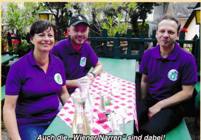
Auch die „Wiener Narren“ sind dabei!