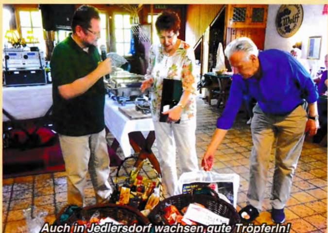
Auch in Jedlersdorf wachsen gute Tröpferln!