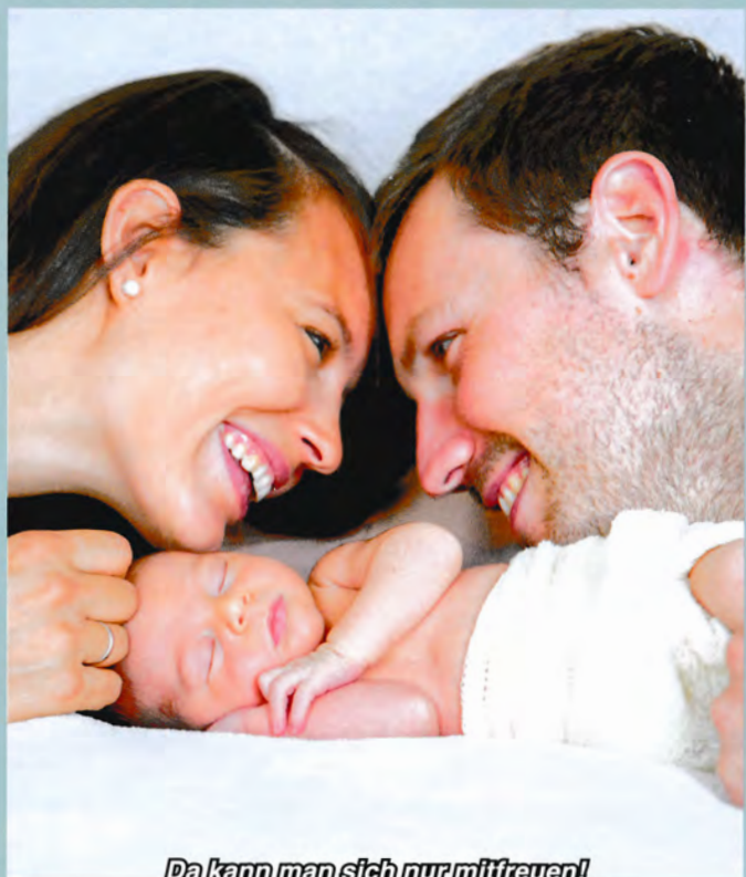
Da kann man sich nur mitfreuen!

Wir freuen uns mit den stolzen Eltern und wünschen allen dreien alles erdenklich Gute!