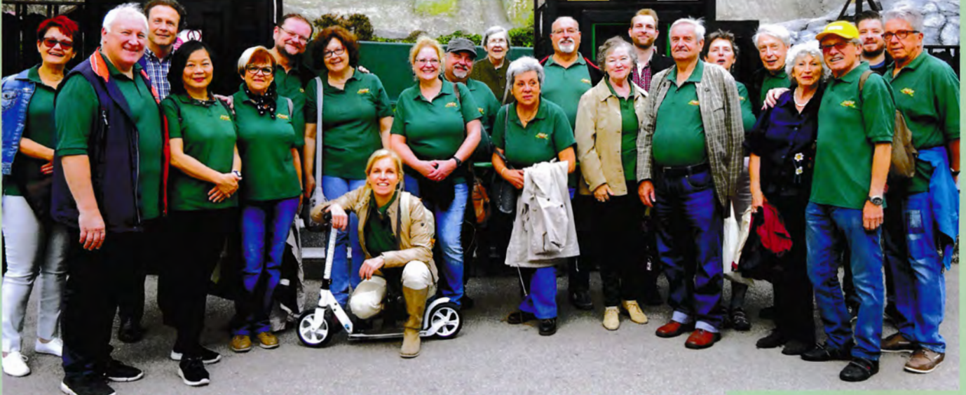
Wieder einmal war das Schweizerhaus das Ziel der alljährlichen „Danke-schön“-Fahrt; mangels eines für alle günstigen Wochenendtermins mit dem 25. Mai diesmal ein Freitagabend.

D ie unsicheren Wetterprognosen ließen die für den Nachmittag vorgesehenen Programmpunkte – Liliputbahn und Wiener Hochschaubahn vulgo „Zwergerbahn“ – zwar etwas wackeln, letztendlich