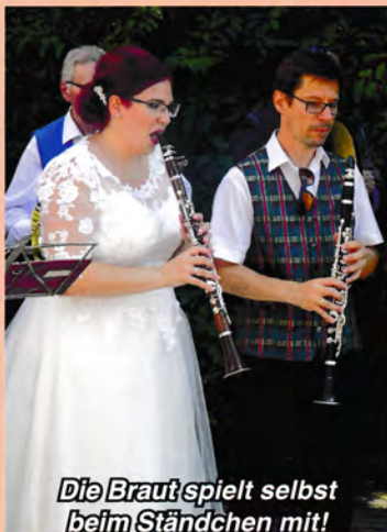
Die Braut spielt selbst beim Ständchen mit!