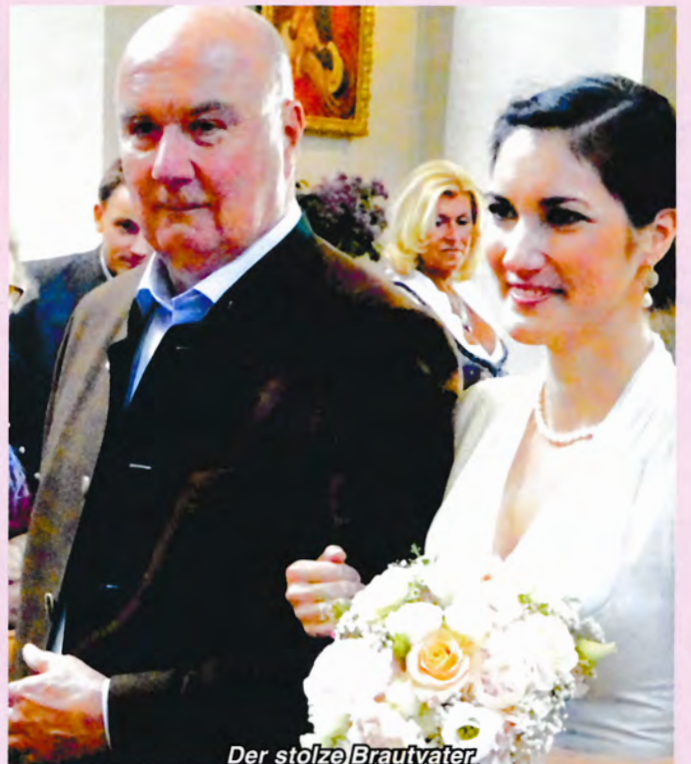
Der stolze Brautvater.