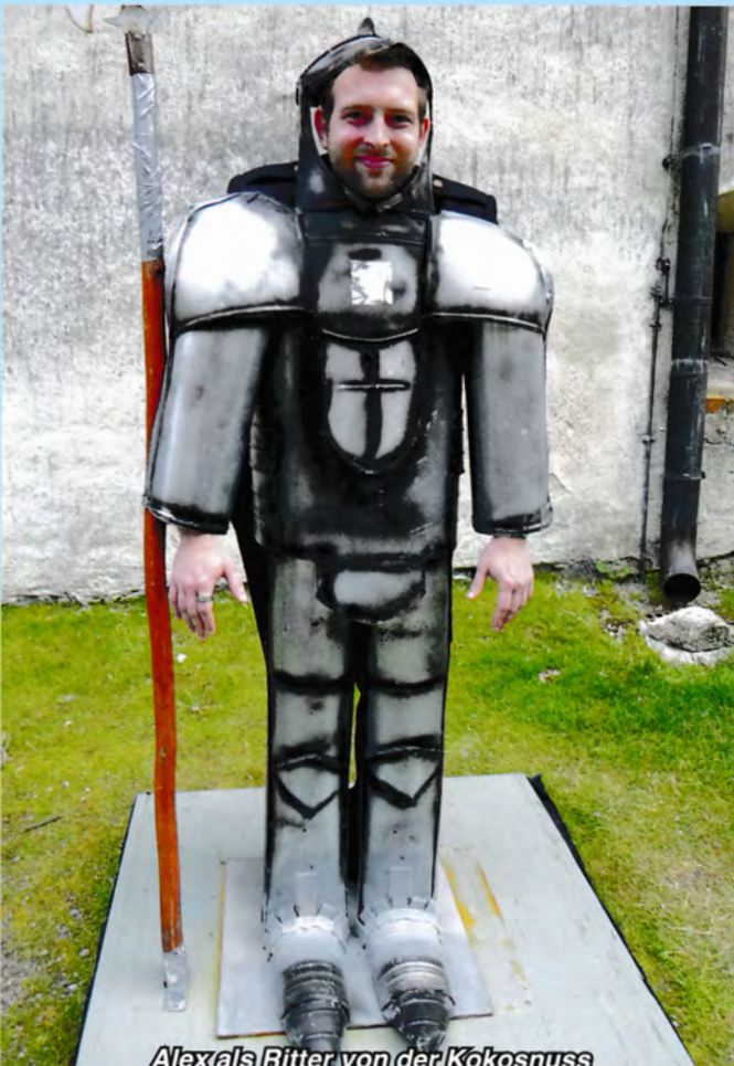
Alex als Ritter von der Kokosnuss