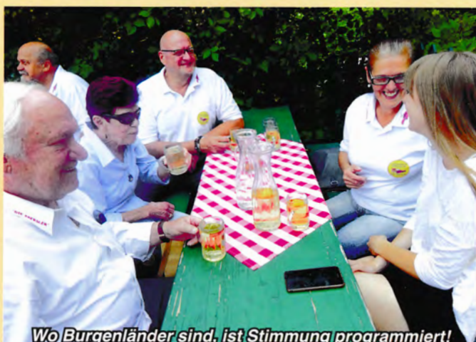
Wo Burgenländer sind, ist Stimmung programmiert!