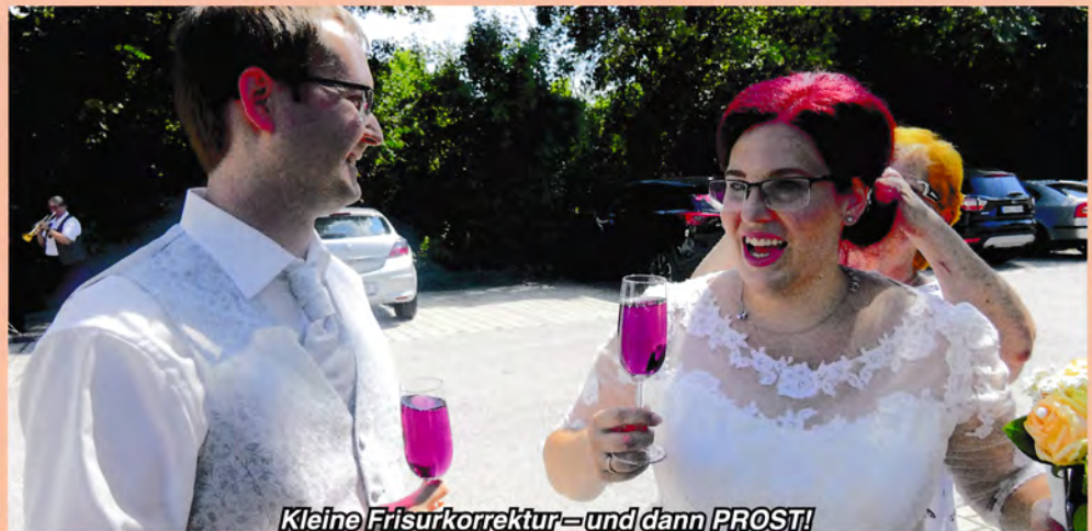
Kleine Frisurkorrektur – und dann PROST!