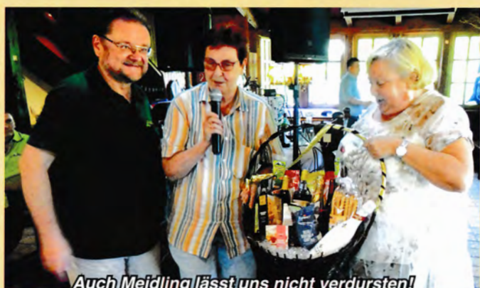
Auch Meidling lässt uns nicht verdursten!