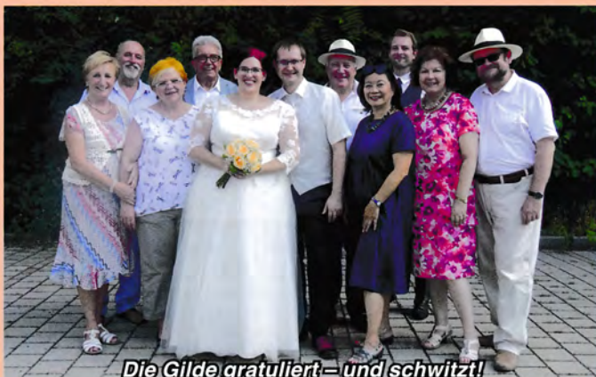
Die Gilde gratuliert – und schwitzt!