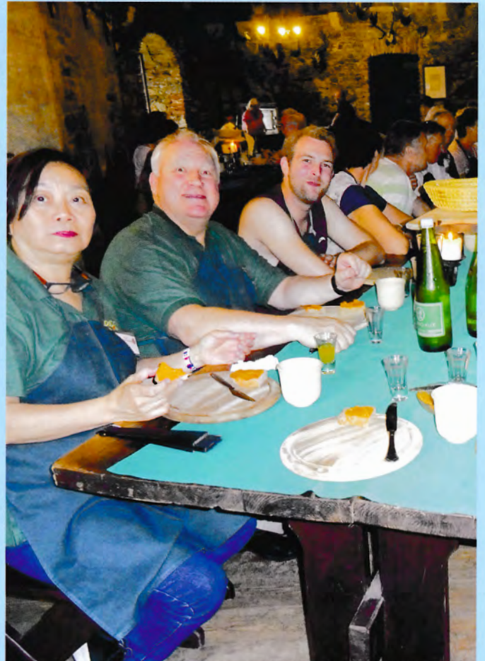
Gut geschürzt, damit unsere neuen LeiberIn nicht leiden!