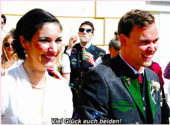
Viel Glück euch beiden!