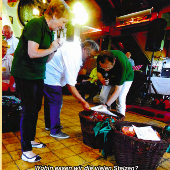
Wohin essen wir die vielen Stelzen?