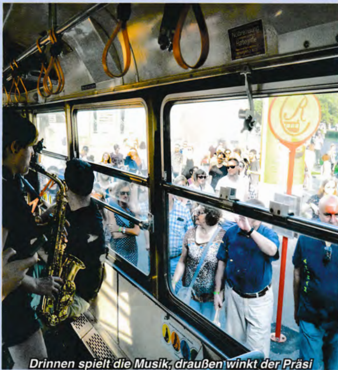
Draußen winkt der Präsi

Ein Tipp für alle, die das tolle Konzert verpasst haben: am 31.8. gibt's im Wertheimsteinpark eine Wiederholung!