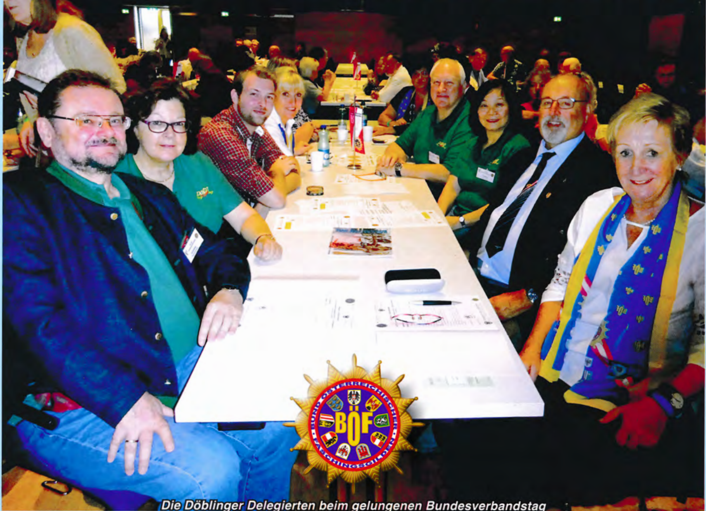
Die Döblinger Delegierten beim gelungenen Bundesverbandstag

Nachdem die Faschingsgilde von Loretto bereits höchst erfolgreich die vorjährige Herbsttagung ausrichtete, waren die Erwartungen hoch, ob dieses tolle Programm denn noch zu top-pen sei.