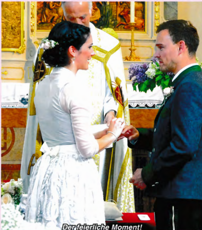
Der feierliche Moment!