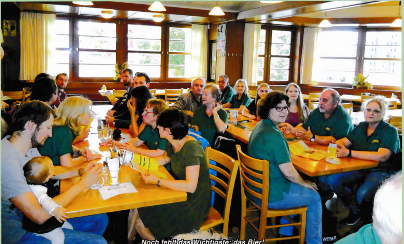
Noch fehlt das Wichtigste: das Bier!