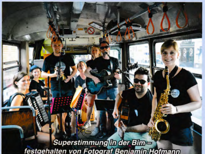
Superstimmung in der Bim