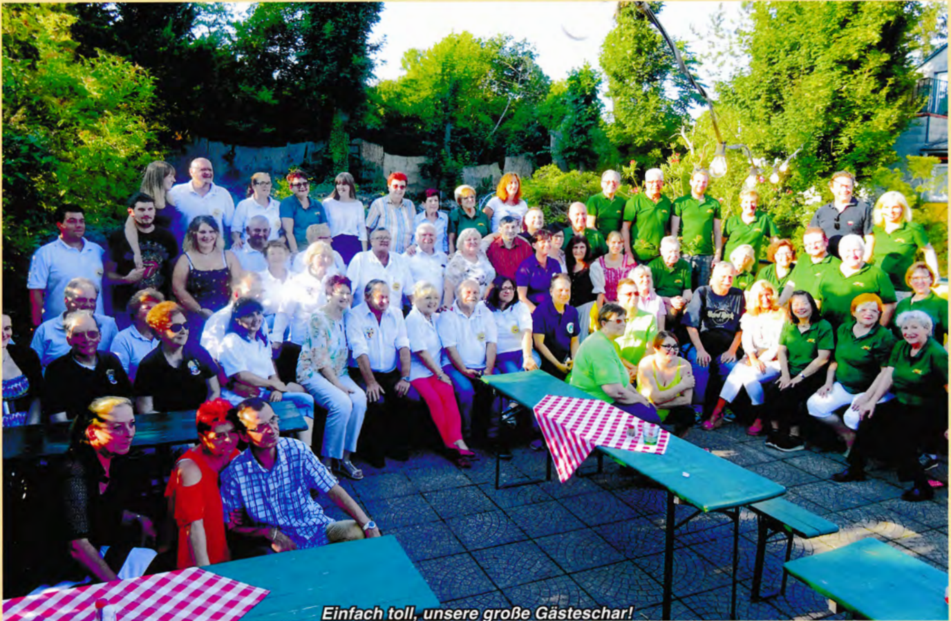
Einfach toll, unsere große Gästeschar!