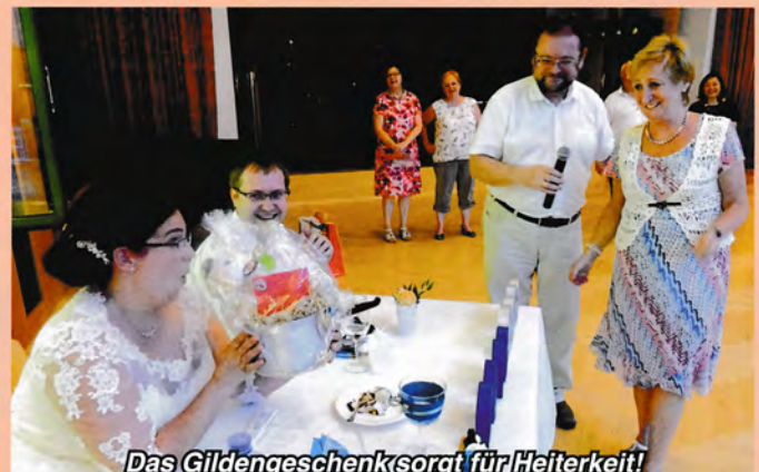
Das Gildengeschenk sorgt für Heiterkeit!