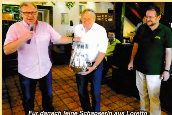
Für danach feine Schapserln aus Loretto