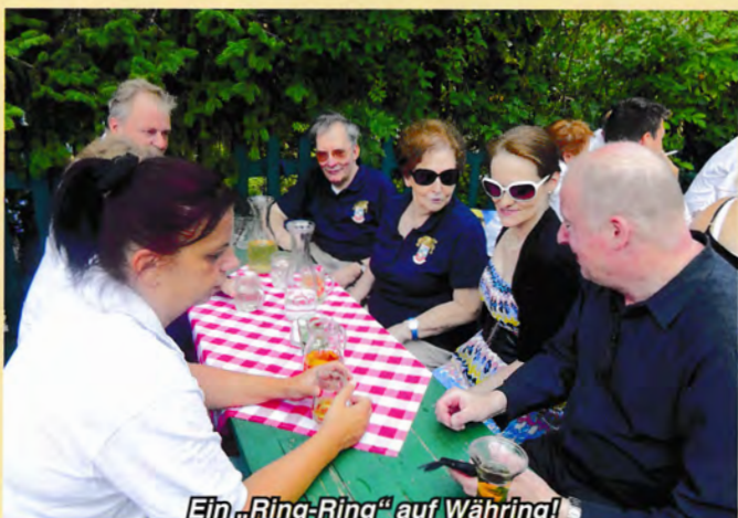
Ein „Ring-Ring“ auf Währing!