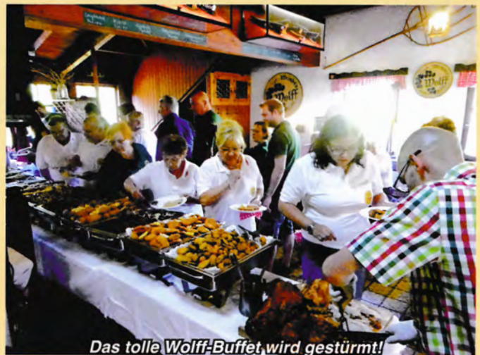
Das tolle Wolff-Bufferet wird gestürmt!